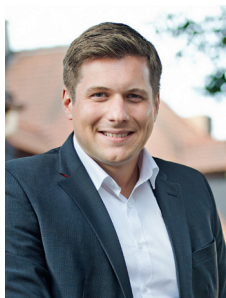
Nicolas Lahovnik Erster Bürgermeister